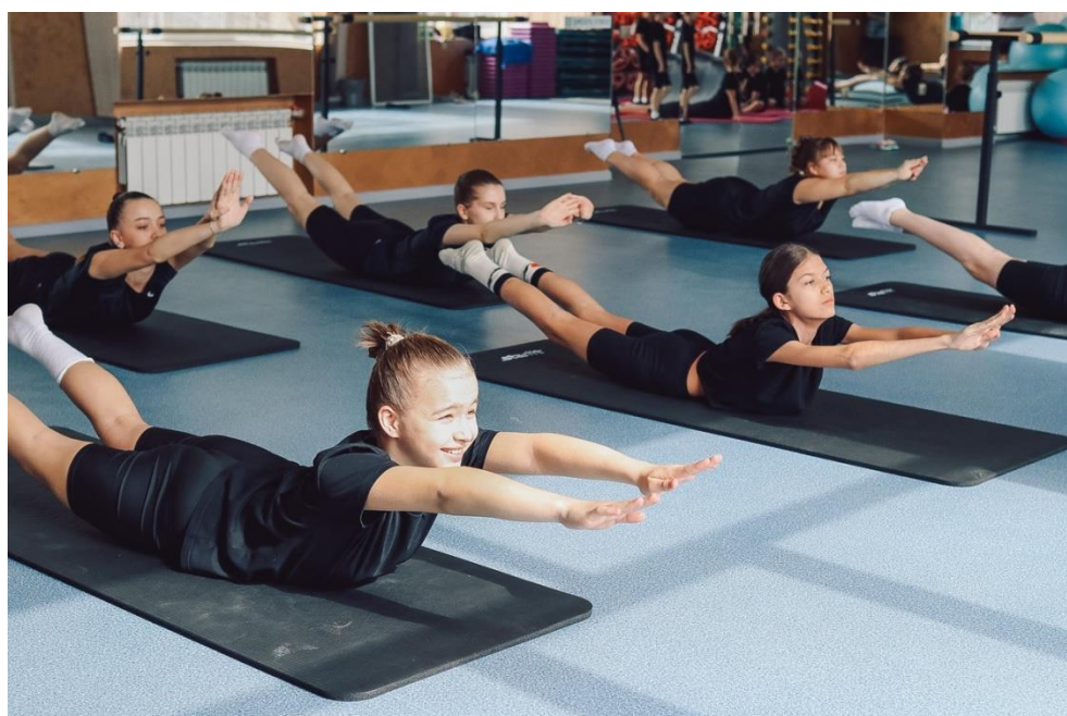
Упражнения для развития мышц спины