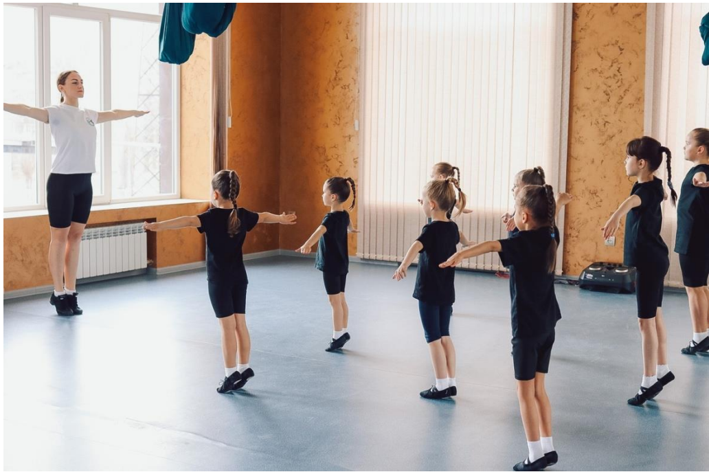
Постановка корпуса. Изучение позиций рук и ног