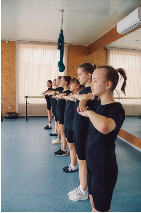
Изучение рисунков танца (линия)